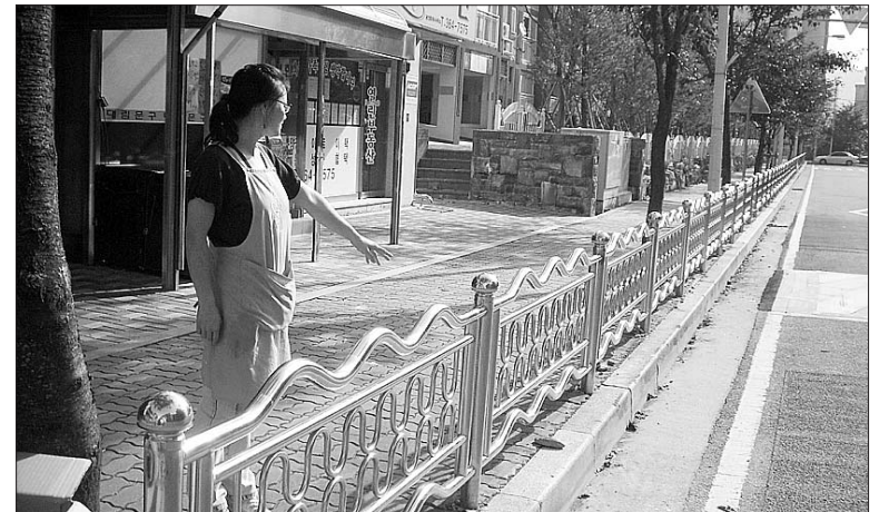
양산신도시 e-편한세상 1차 아파트 상가변영회가 고려개발 측에 철거를 요구하고 있는 상가 앞 문제의 헬스.

시는 개발계획이 확정되면 내년 3~4월께 공모를 통해 민간사업자를 선정된 뒤 그해 7월 본격사업에 착수, 오는 2010년 준공한다는 계획을 세워놓고 있다. 이 사업이 완료되면 김해시가지 중심도시가 밀집된 서부권에 비해 상대적으로 낙후된 동부권의 문화, 레저 시설 확보문제가 다소간 해결될 것으로 기대된다. 이에 시 관계자는 "가야역사 문화환경정비계획의 역사자원과 자연자원을 연계한 휴양공간 확보를 위해 사업을 추진하고 있다"면서 "이 사업이 완료되면 관내에 다소 부족한 수변레저 및 생태교육 공간이 제대로 확보될 수 있을 것"이라고 말했다.