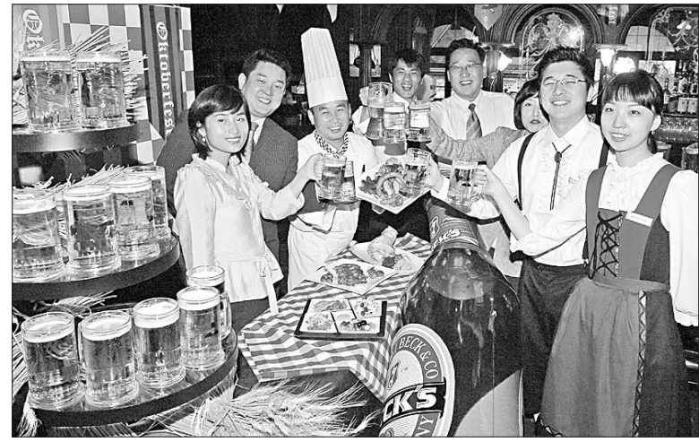
독일 맥주축제 독일 맥주축제인 '옥도버 페스트'가 25일 파라다이스호텔 부산 찰리스 룸에서 열려 맥주축제장을 찾은 고객들이 독일식 소시지와 함께 맥주를 즐기고 있다.

이에 대해 구청 관계자는 "수정2동 놀이터가 평소 청소년들의 비행장소로 악용되는 등 놀이터 역할을 제대로 못해 폐쇄하더라도 별 문제가 없을 것으로 판단했다"며 "인근 아이들에게는 미안하지만 공간 문제 때문에 놀이터를 추가로 만들 계획은 없다"고 해명했다. 김종열·정선연기자